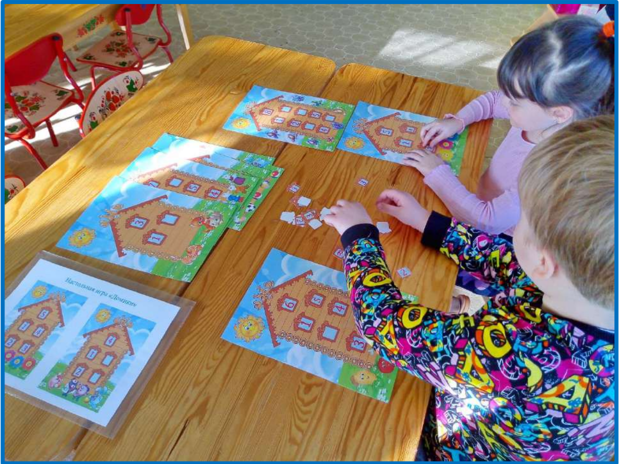
Формирование представлений об окружающем мире